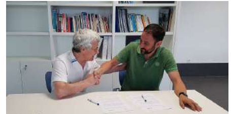
Momento da sinatura do convenio coa empresa de aluminios SEFER de Padrón para a realización de prácticas.

“Facilyta o movemento “ e “Les facilyta” son os nomes dos dous proxectos que Sarela lidera para toda España dentro dunha iniciativa da Fundación Vodafone. O seu obxectivo é empregar os móbiles e tabletas como apoio para realizar actividades que, debido a problemas de memoria, planificación etc, non poden realizar.