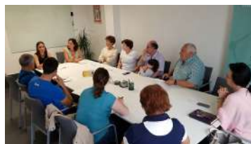
Clase de informática e formación sobre mobilización, e recursos e prestacións.