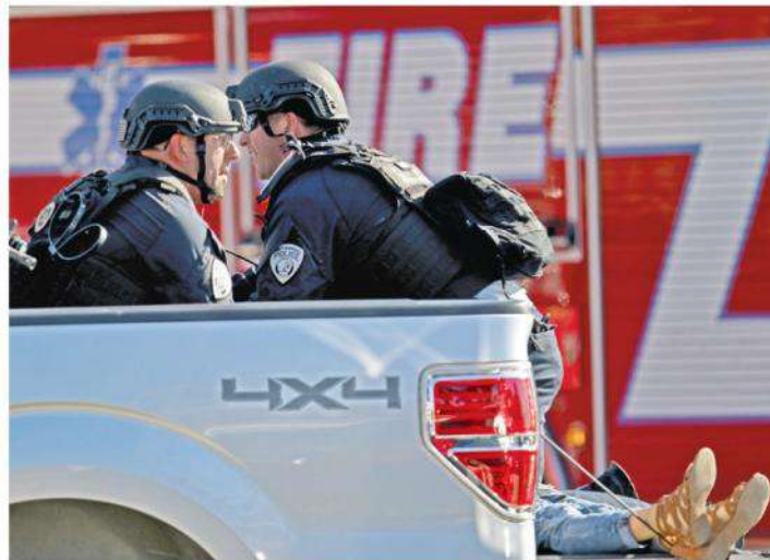
A shooting victim was assisted Wednesday at Marjory Stoneman Douglas High School in Parkland, Fla., northwest of Miami.

de que alguén entre armado nos colexios e institutos, pero a verdade é que a nós non nos convence demasiado.