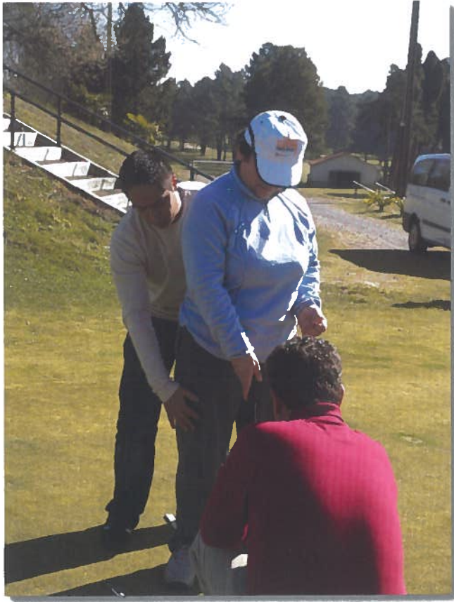
Fig. 1. Alineación dos diferentes segmentos corporais para a axeitada execución do movement.

De igual forma manexamos outro aspecto fundamental para o logro dun bo control postural e é o da alienación dos puntos clave, que son determinadas partes do corpo que reciben grande cantidade de información que posteriormente reenvían de novo ao Sistema Nervioso e cuxo manexo inflúe controlando e mellorando os patróns de postura e movement noutras partes do corpo. Estes puntos son: