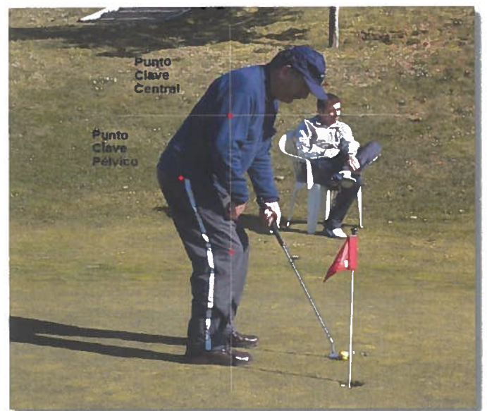
Fig. 2. A correcta alineación dos puntos clave permiten un axeitado patrón postural e unha efectiva realización dos movementos.