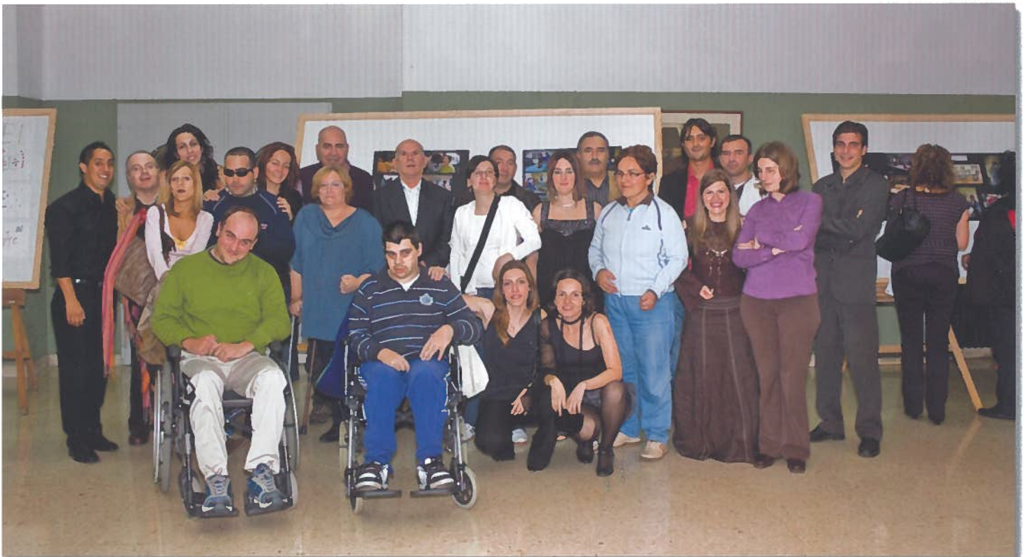
Foto de usuarios e profesionais de Sarela na estrea da curtametraxe "Danko"

adiante. Moitas gracias a todo o mundo que o viu e que lle gustou xa que nos sentimos moi satisfeitos do traballo ben feito.