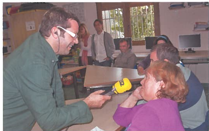
Mercedes contestando a preguntas do reporteiro