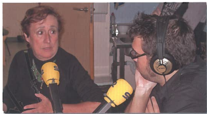
A Concelleira de Benestar Social do Concello de Santiago de Compostela