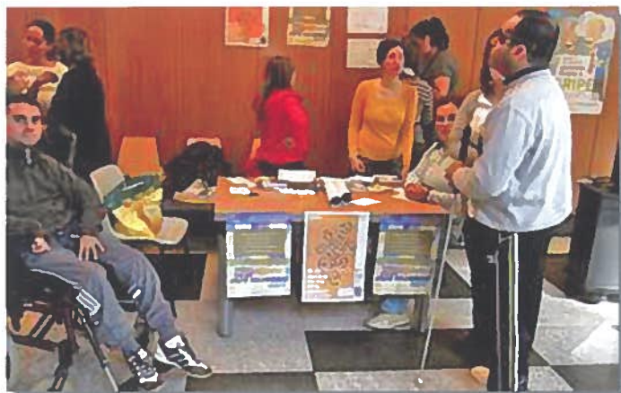
Mesa informativa no Hospital Clínico de Santiago